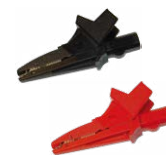
Cocodrilo 1 kV 20 A negro / rojo