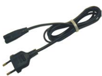
Cable de alimenta- ción 230 V (co- nector IEC C7)