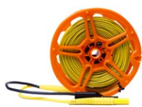
Cable 50 m para me- dir la toma de tierra en carrete (conec- tores tipo banana, blindado) amarillo