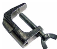
Mordaza (conec- tor tipo banana)