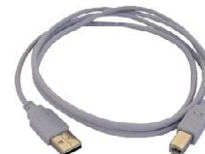
Cable de transmi- sión, terminado con conector USB