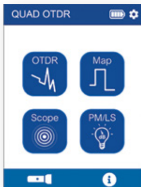
Pantalla de inicio

sus pasos, como se puede ver a continuación. Para aplicaciones FTTH/FTTx, el OTDR PON identifica los ratios de división para comprobar las redes activas o inactivas y detectar y solucionar problemas. Su longitud de onda de 1625 nm permite realizar comprobaciones en servicio de redes sin interrumpir a los suscriptores.