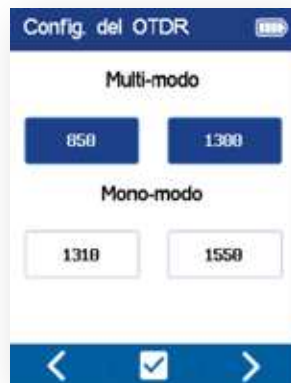
Seleccionar longitud(es) de onda