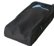
funda M3 WAFUTM3