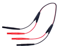
cable 0,6 m de dos hilos para TDR