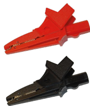
cocodrilo rojo / negro 1 kV 20 A