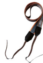
Arnés tipo M1 (TDR-420)