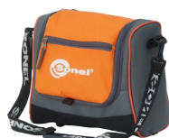
funda M6 (TDR-420)