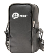
funda M2 (TDR-410)